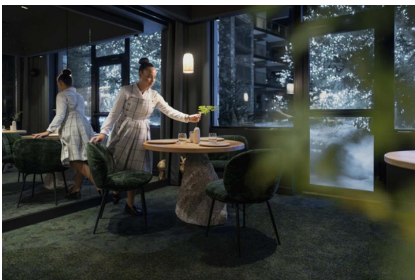
Alpage à l'Annapurna