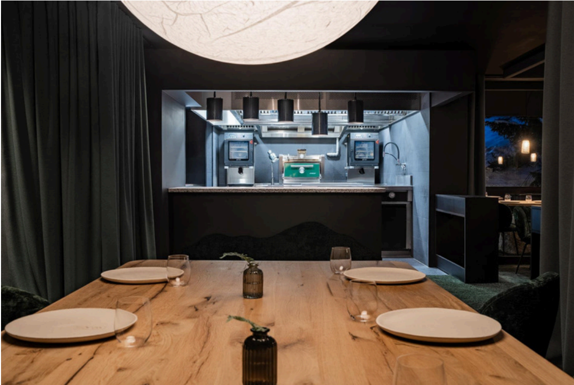
Alpage à l'Annapurna

L'espace, pensé par l'Atelier Giffon et Jean-Rémi Caillon, est à la fois brut et sophistiqué, proche d'un cocon, mais avec une grande ouverture sur l'extérieur comme sur la cuisine du chef. Composé d'une petite vingtaine de couverts, il dispose à la fois de tables individuelles et d'une table d'hôtes de 8 places, disposée de telle sorte qu'on puisse à la fois admirer la nature et le geste du chef.