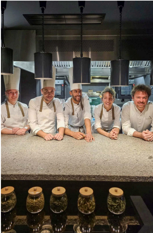
Alpage