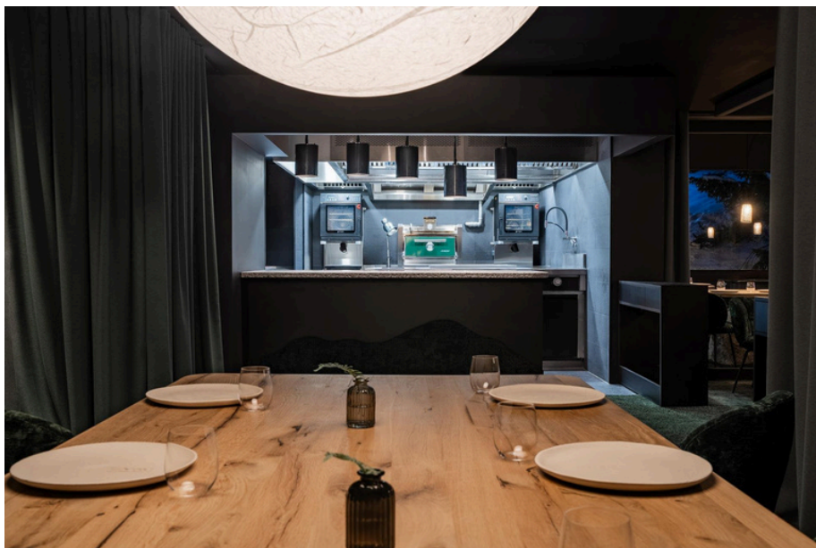
Alpage à l'Annapurna

L'espace, pensé par l'Atelier Giffon et Jean-Rémi Caillon, est à la fois brut et sophistiqué, proche d'un cocon, mais avec une grande ouverture sur l'extérieur comme sur la cuisine du chef. Composé d'une petite vingtaine de couverts, il dispose à la fois de tables individuelles et d'une table d'hôtes de 8 places, disposée de telle sorte qu'on puisse à la fois admirer la nature et le geste du chef.